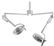
Duo 10/10 C