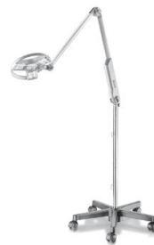
20-2 PTX + stojan pojízdný ND15.595.000