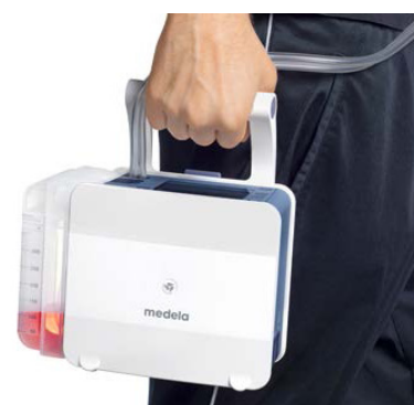
Včasná mobilita pacienta

Lehký, kompaktní design a dobíjecí baterie podporují včasnou mobilitu pacienta. Automatické stmívání displeje a tichý provoz zvyšují spokojenost pacienta, zatímco alarmy a oznámení prohlubují jeho pocit bezpečnosti a důvěry.