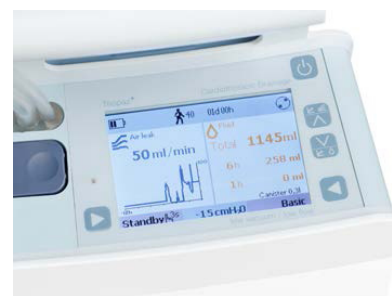
Objektivní údaje a přesnost

Průběžné monitorování úniku vzduchu, podtlaku a množství kapaliny umožňuje efektivní a inteligentní řízení hrudní drenáže. Tyto parametry jsou k dispozici v reálném čase a na displeji Thopaz + se zobrazují trendy za posledních až 72 hodin. Záznam terapie je možné stáhnout do počítače pro vyhodnocení a založení do lékařské dokumentace pacienta. Společně tyto údaje poskytují klinická kritéria potřebná pro optimální řízení hrudní drenáže a pro rozhodnutí o odstranění drénu.