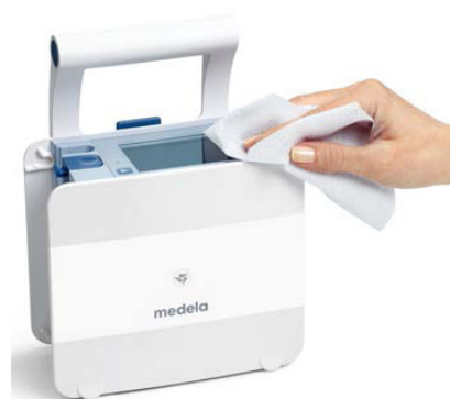
Hygienický a kompaktní

Thopaz + zjednodušuje každodenní kontrolu hrudní drenáže a zároveň poskytuje zlepšené provozní funkce. Ovládání tlačítky a barevný displej zabezpečují intuitivní ovládání a manipulaci. Kromě toho kompaktní design podporuje manipulaci s minimální kontaminací přístroje, jednoduché čištění a pohodlné skladování.